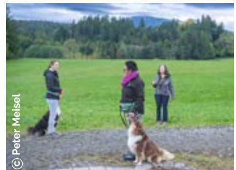
Finnischer Lapphund und Aussie

Hundesportverein Oberammergau, Malensteinweg 16, 82487 Oberammergau